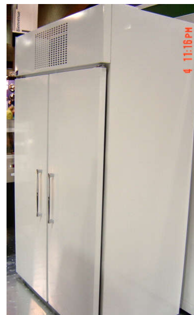
Modèle FSH48T (Compresseur en haut)