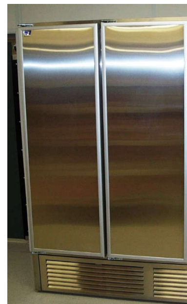
Modèle FSH48B (Compresseur en bas) Montré avec l'option finition acier inoxydable