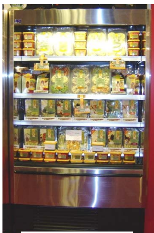
Modèle CES avec bouts solides