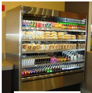
Modèle CES avec bouts solides