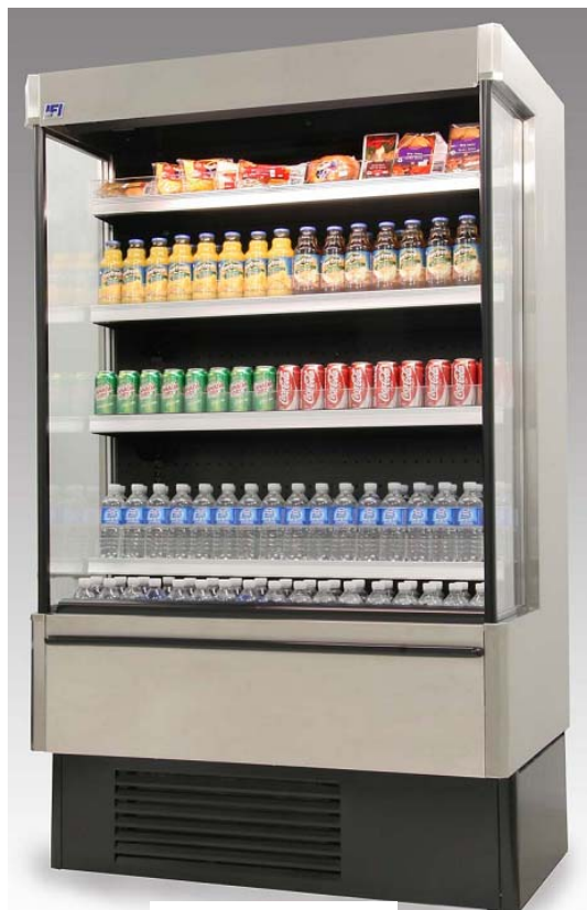
Modèle CEG avec bouts vitrés